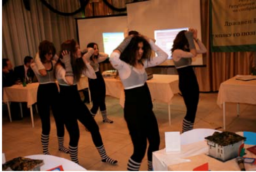
Дел од уметничките точки.

Од регионот Битола учествуваа учениците од ОУ “Манчу Матак” од с.Кривогаштани,